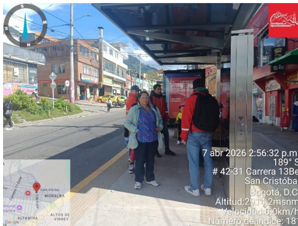
Evidencia Fotografía 3. Sensibilización a personas en paradero SITP

La actividad permitió fortalecer la presencia institucional en el sector y generar mayor conciencia en la comunidad frente a la prevención del hurto, contribuyendo a mejorar la percepción de seguridad en el transporte público.