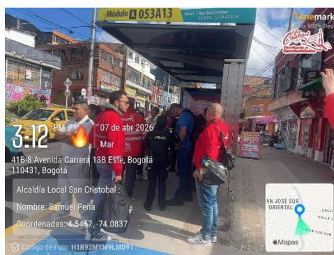
Evidencia Fotografía 1. Sensibilización y registro junto con Policía Nacional

OBJETIVO: REALIZAR LA CAMPAÑA DE PREVENCION ANTE EL HURTO EN TRANSPORTE PUBLICO